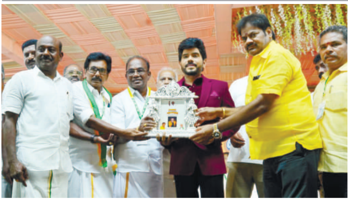
திருவாரூரில் 43-வது வணிகர் தினம்